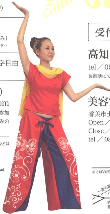
※写真はサンプル衣装です。実際の衣装とはデザイン、カラーが異なる場合があります。